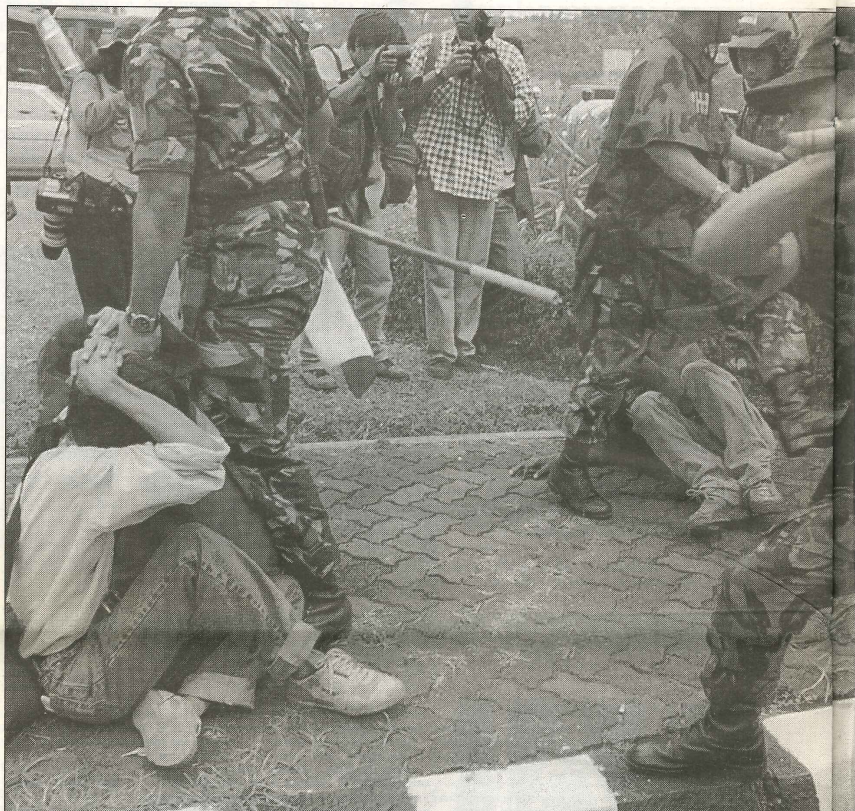
OPPRØRET SOM FORSVANT: Studentene tvang eliten til å kvitte seg med Suharto. Siden mistet demokrati-bevegelsen farten

Studentene – som tvang eliten til å kvitte seg med Suharto våren 1998, som var i forkant av reformeringsprosessen og som presset de tradisjonelle politikerne – mistet momentum og ble marginalisert. Og genuine aktivister for utvikling, menneskerettigheter og demokrati har allerede lenge sagt at deres forsøk på å hjelpe folk til