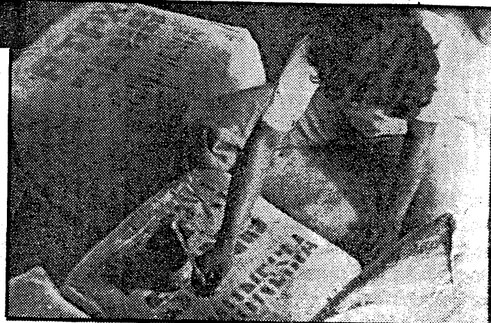
Texten på exportpaketet ser rationellt stämplat ut — men den är omsorgsfullt målad för hand. Ändå räcker inte jobben.

I småbyarna omkring är träden kvar. Men bakom kvinnor som vaskar vid flodkanten smattrar japanska motorcyklar. De väntar på bambufärjorna, som stakas för hand.